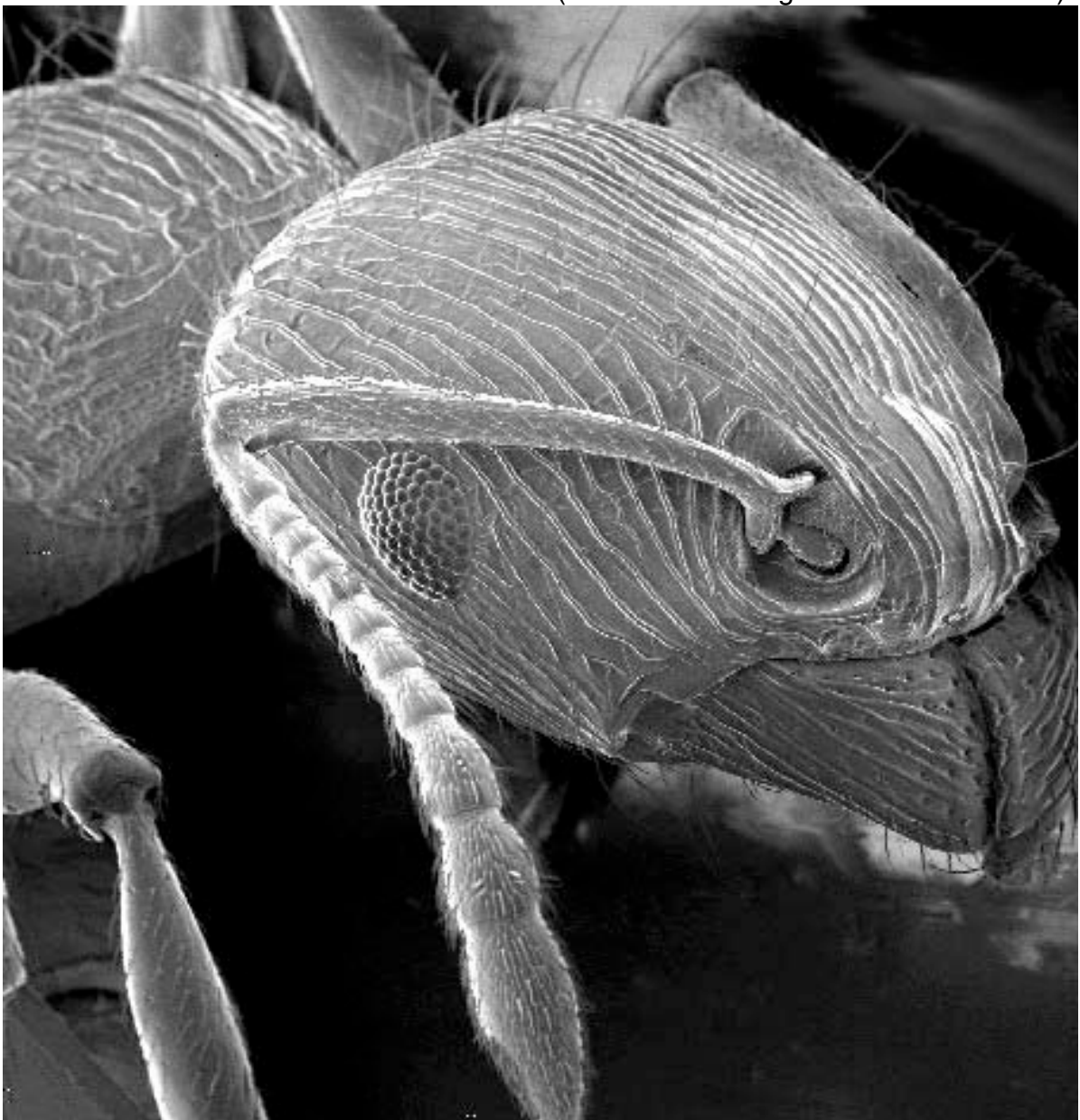
Cabeza de hormiga vista por un microscopio de barrido (en "Nanotecnología" en Documenta01)